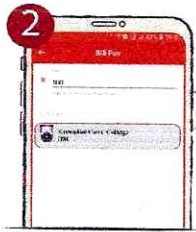
২. বিলার তালিকা থেকে Kumudini Govt. College সিলেক্ট করুন