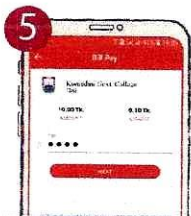
৫. পিন টাইপ করুন