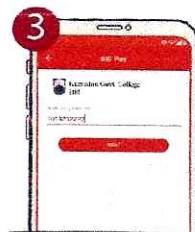
৩. Student ID/Class Roll প্রদান করুন