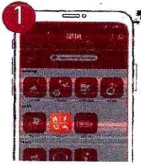
১. বিল পে বাটনে ক্লিক করুন