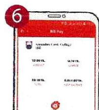
৬. ট্যাপ করে ধরে রাখুন পেমেন্ট শেষে কনফার্মেশন নোটিফিকেশন পাবেন