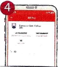
৪. সকল তথ্য যাচাই করুন