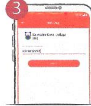
৩. Student ID/Class Roll প্রদান করুন