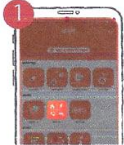
১. বিল পে বাটনে ক্লিক করুন