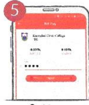
৫. পিন টাইপ করুন