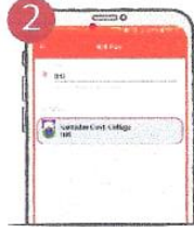
২. বিলার তালিকা থেকে Kumudini Govt. College সিলেক্ট করুন