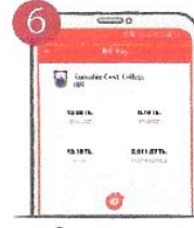
৬. ট্যাপ করে ধরে রাখুন পেমেন্ট শেষে কনফার্মেশন নোটিফিকেশন পাবেন

ভারপ্রাপ্ত অধ্যক্ষ কুমুদিনী সরকারি কলেজ টাঙ্গাইল।