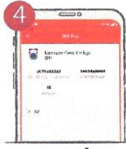
৪. সকল তথ্য যাচাই করুন