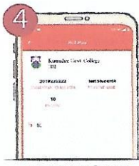
৪. সকল তথ্য যাচাই করুন