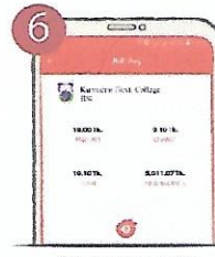
৬. ট্যাপ করে ধরে রাখুন পেমেন্ট শেষে কনফার্মেশন নোটিফিকেশন পাবেন