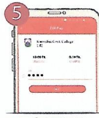
৫. পিন টাইপ করুন