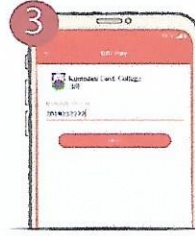
৩. Student ID/Class Roll প্রদান করুন