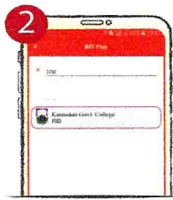
২. বিলার তালিকা থেকে Kumudini Govt. College সিলেক্ট করুন