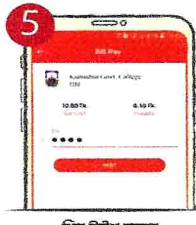
৫. পিন টাইপ করুন