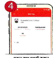
৪. সকল তথ্য যাচাই করুন