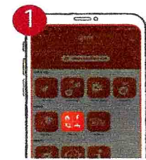
১. বিল পে বাটনে ক্লিক করুন