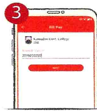
৩. Student ID/Class Roll প্রদান করুন