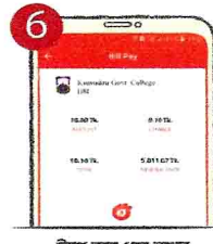
৬. ট্যাপ করে ধরে রাখুন পেমেন্ট শেষে কনফার্মেশন নোটিফিকেশন পাবেন