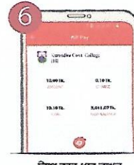
৬ ট্যাপ করে ধরে রাখুন পেমেন্ট শেষে কনফার্মেশন নোটিফিকেশন পাবেন