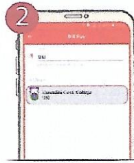
২ বিলার তালিকা থেকে Kumudini Govt. College সিলেক্ট করুন