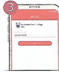
৩ Student ID/Class Roll প্রদান করুন