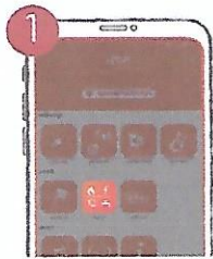
১ বিল পে বাটনে ক্লিক করুন