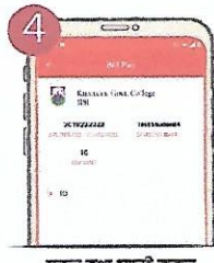
৪ সকল তথ্য যাচাই করুন